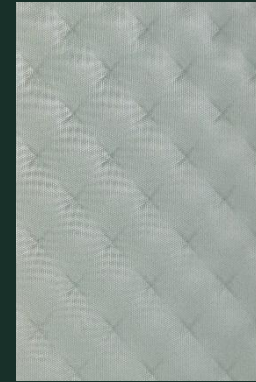
SZKŁO LAKIEROWANE MASTENSOFT