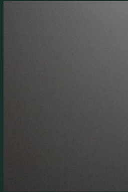
SZKŁO LAKOBEL RAL9005