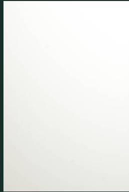
SZKŁOLAKOBEL RAL 9003